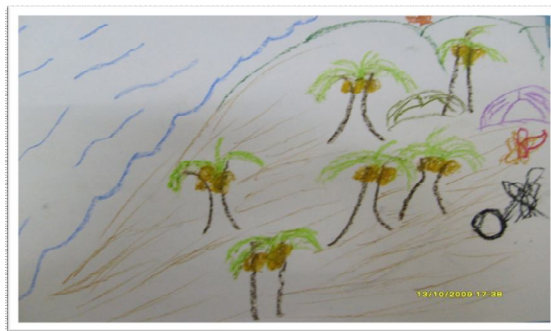
Gambar 2: Pemandangan di tepi pantai

Dalam sesi kedua pula, Zack telah melukis satu pemandangan di tepi pantai yang cantik. Beberapa batang pokok kelapa juga telah dilakarnya seperti yang ditunjukkan pada Gambar 2.